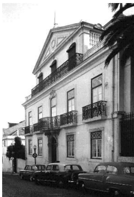
Figura 3: Palácio do Conde das Antas