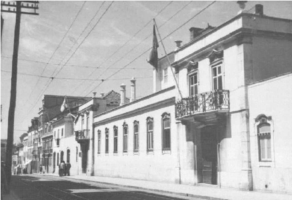
Figura 4: Palácio dos Viscondes dos Olivais, Rua de Buenos Aires, 16 Instalações da ECIC e do IIL entre 1914 a 1971. Cota: 30406

No início do ano de 1919 renasce o Instituto Industrial de Lisboa (IIL) , pelos decretos nº 5029 de 05 de dezembro de 1918 (capítulo VII estabelece as bases gerais para os institutos industriais de Lisboa e do Porto) e nº 5100 de 11 de janeiro de 1919 que correspondente ao respetivo regulamento, com instalações da ECIC, na rua Buenos Aires em Lisboa.