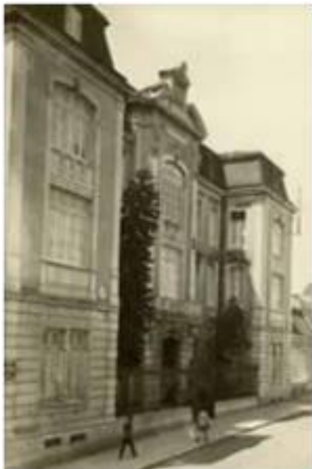
Figura 2: Instalações da Escola Industrial Marquês de Pombal, no início do século XX.