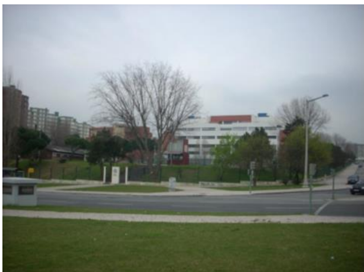
Figura 5: Campus do ISEL em 2009

O ISEL adotou as licenciaturas bietápicas tendo saído legislação regulamentar específica para cada um dos cursos a lecionar, entre 1998 e 2000, tendo sido abolidos os CESE. Com a revisão da Lei de Bases do Sistema Educativo de 1997 é estabelecido o direito ao ensino superior politécnico de lecionar o grau de licenciatura, em condições de equidade com o ensino superior universitário.