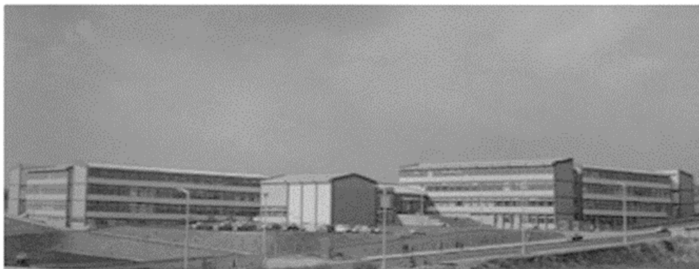
Figura 5: Instalações do ex-IIL (atual ISEL): 1971.