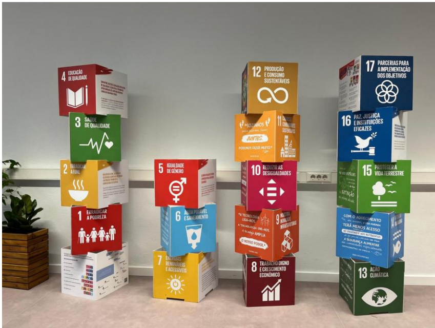
Sala de estudo