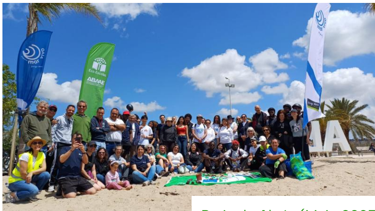
Praia de Algés (Maio 2025)