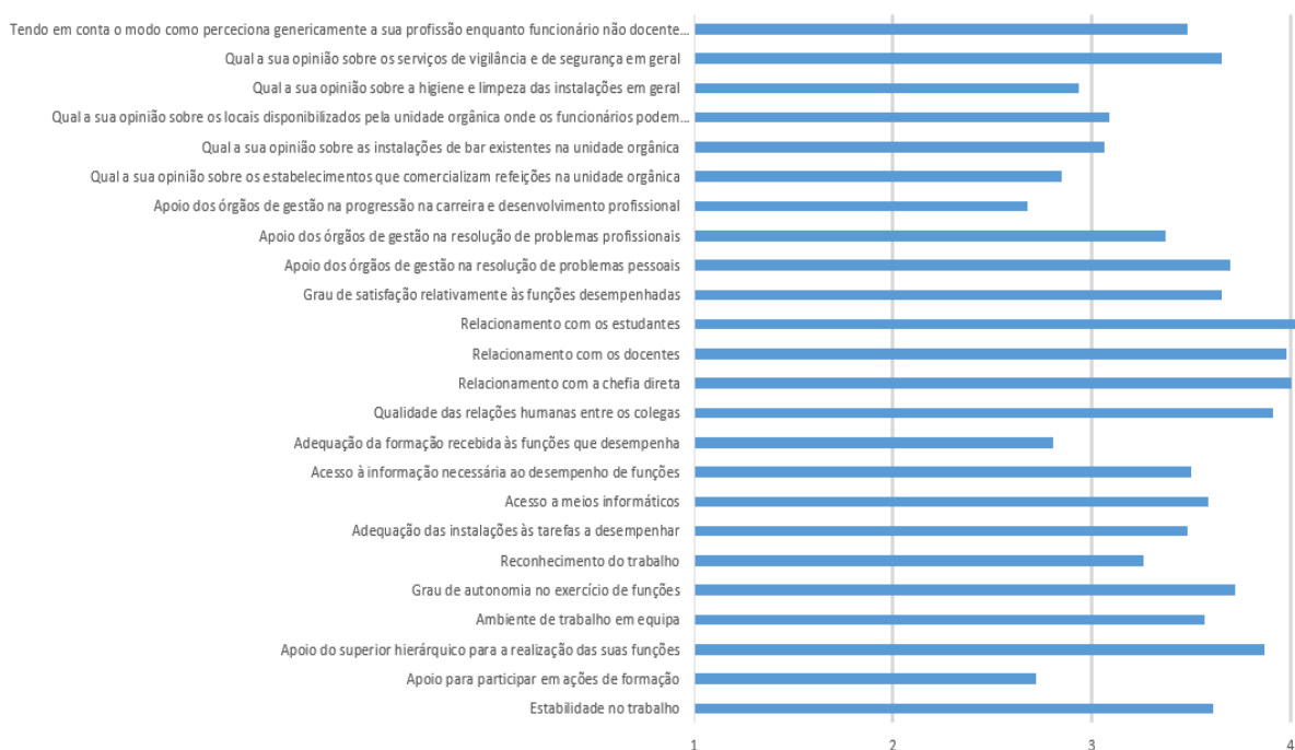
Figura 1. Satisfação dos Não Docentes por questão

Os resultados do Inquérito de satisfação efetuado aos trabalhadores não docentes evidenciam que, em termos genéricos, estão menos satisfeitos com as “Condições Gerais de Desempenho (Instalações)” e mais satisfeitos com o seu “Horário ser compatível com os transportes públicos” [Figura 1], sendo que em termos de pormenor, estão menos satisfeitos com o “Os estabelecimentos que comercializam refeições na unidade orgânica” e estão mais satisfeitos com o “O horário ser compatível e adequado ao dos transportes públicos que utiliza diariamente”.