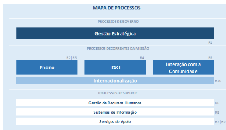
Figura 1. Mapa de Processos do SIGQ

Este planeamento concretiza-se através da afetação de recursos e responsáveis às ações a implementar [Figura 1].